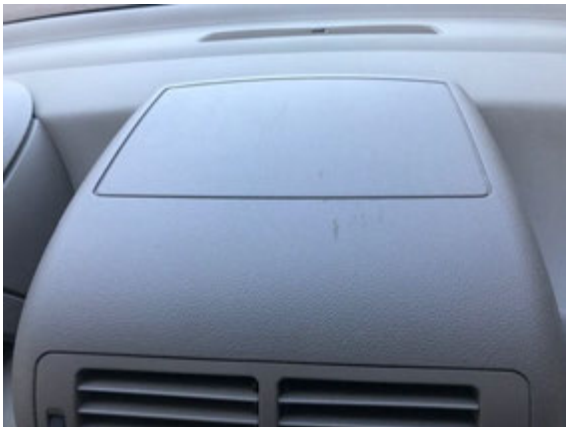
Lichte krassen in het dashboard.