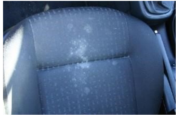
Vlekken in de autobekleding die niet door normale reiniging kunnen worden verwijderd.