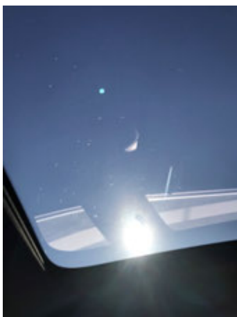
Krasjes aan het panoramadak die gepolijst kunnen worden.