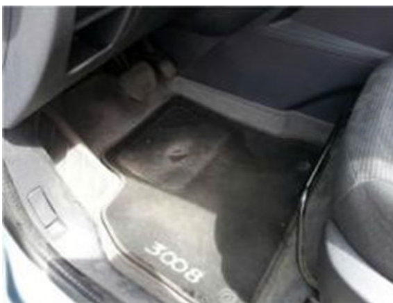
Normale slijtage bij een acceptabele leeftijd en kilometerstand.