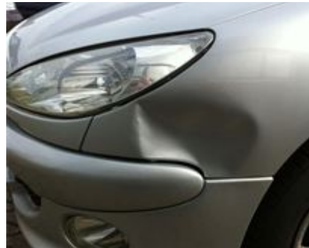
Deuk groter dan een 1 euro munt.