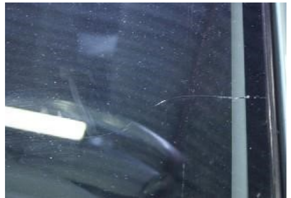
Scheur in voorruit.