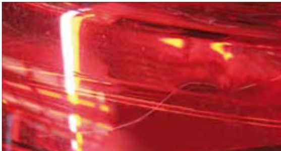
Kras op verlichting die gepolijst kan worden.