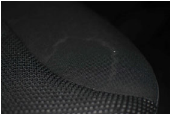
Vlekken in de autobekleding die door normale reiniging te verwijderen zijn.