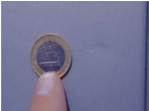
Deukjes kleiner dan een 1 euro munt (maximaal 3).