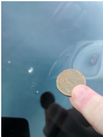
Pit in voorruit kleiner dan 2 cm (maximaal 3)