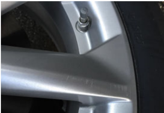
Lichte schraafplek kleiner dan 5 cm (maximaal 3).