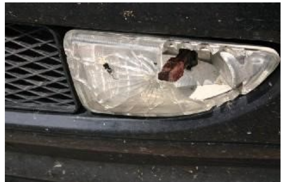
Verlichting functioneert niet meer.