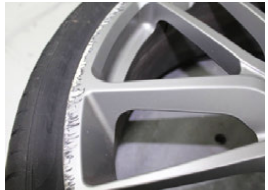
Diepe schraafplekken groter dan 5 cm.