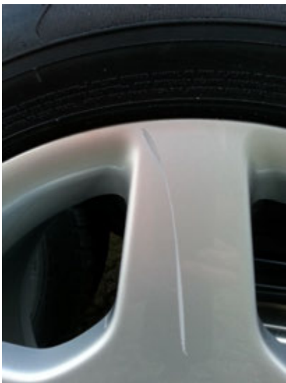
Lichte kras kleiner dan 5 cm (maximaal 3).