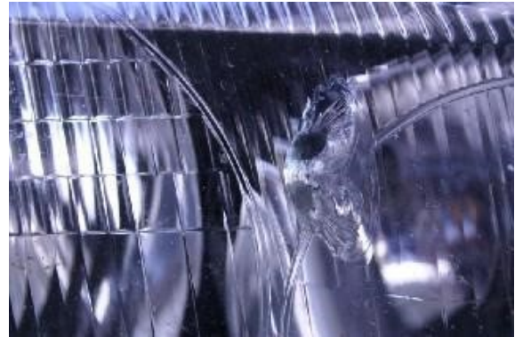
Gat in voorverlichting.