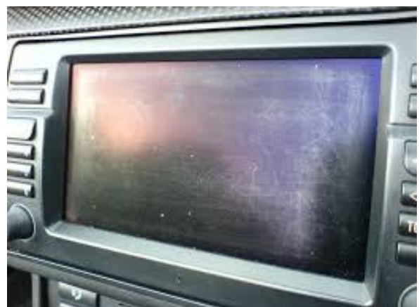
Zowel veel als diepe krassen in het display van de auto.