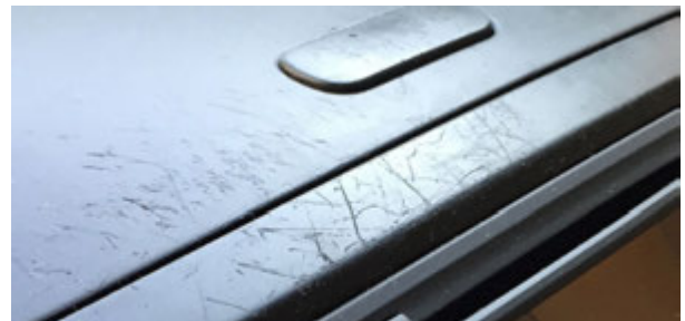
Diepe krassen in het dashboard.