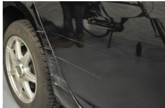
Krassen die door de lak heen zijn.