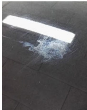
Ingebrande vogelpoep in de lak.