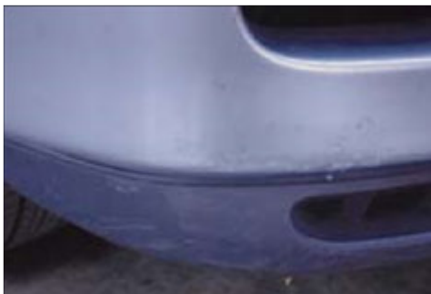
Krassen op de bumper die gepolijst kunnen worden (maximaal 3).