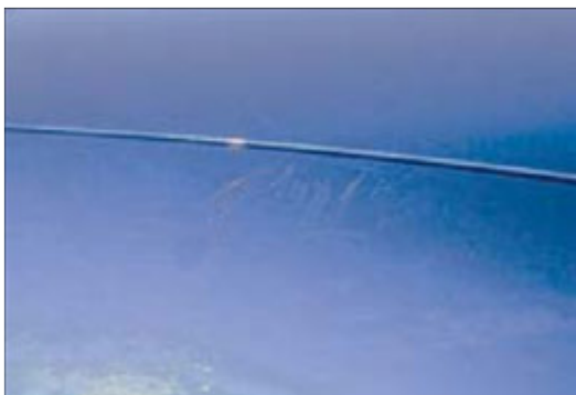
Maximaal 3 krassen die niet door de lak heen zijn en gepolijst kunnen worden.